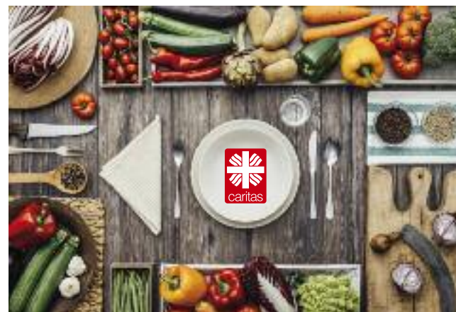
Stand Januar 2018