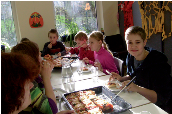
Sehr beliebt: das gemeinsame Kochen und Essen.

Die Angebote sind völlig freiwillig und kostenlos. Wer möchte, kann an einem Tag oder an fünf Tagen die Woche kommen.